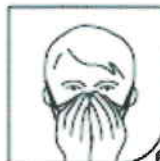
Schéma 1. / Figura 1. / Abbildung 1. / Şekil 1. / Figura 1. / Figura 1. / Afbeelding 1. / Číslo 1. / Figura 1. / Rys. 1. / 1. ábra. / Εικόνα 1. / 1. рис. / Figure 1.

3M France Bd de l'Oise 95006 Cergy Pontoise Cedex +33 1 30 31 61 61